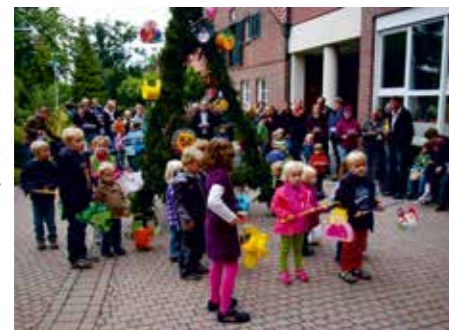
Die traditionelle Lambertifeier am Franziskushaus ist in jedem Jahr sehr beliebt bei Klein und Groß.