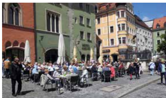
Jedes Jahr an einem anderen Ort – Unsere Gruppenreisen.