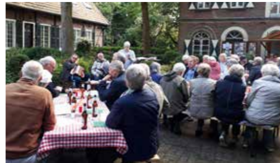
Unser Offenes Singen auf dem Hof Reckfort, Westeroode 33.