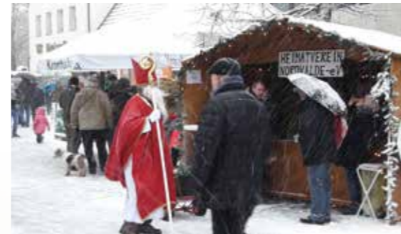
Auf dem Nordwalder Weihnachtsmarkt .