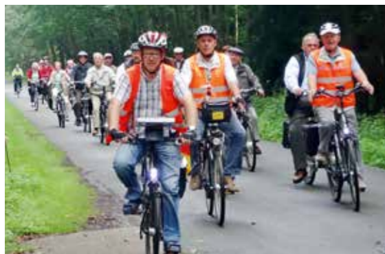
Bei Radtouren im und ums Münsterland Geselligkeit erfahren.